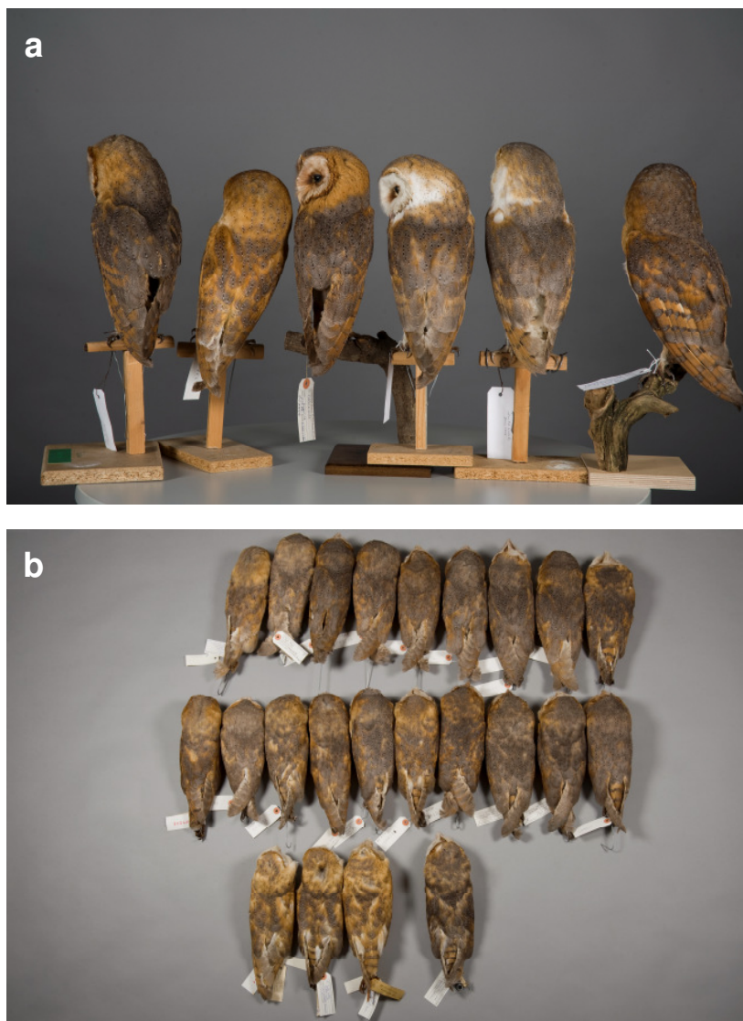
Abb. 3: Die Oberseite ist auf hellem Grund grau gezeichnet. Unterseits helle Individuen haben zumeist einen eher gelblichen Grundton auf der Oberseite, während unterseits dunkle Individuen einen dunkler orangenen Grundton zeigen. (a) Die selben Individuen wie auf Tafel 1b (umgekehrte Reihenfolge). (b) Die selben Individuen wie auf Tafel 2a (gleiche Reihenfolge).