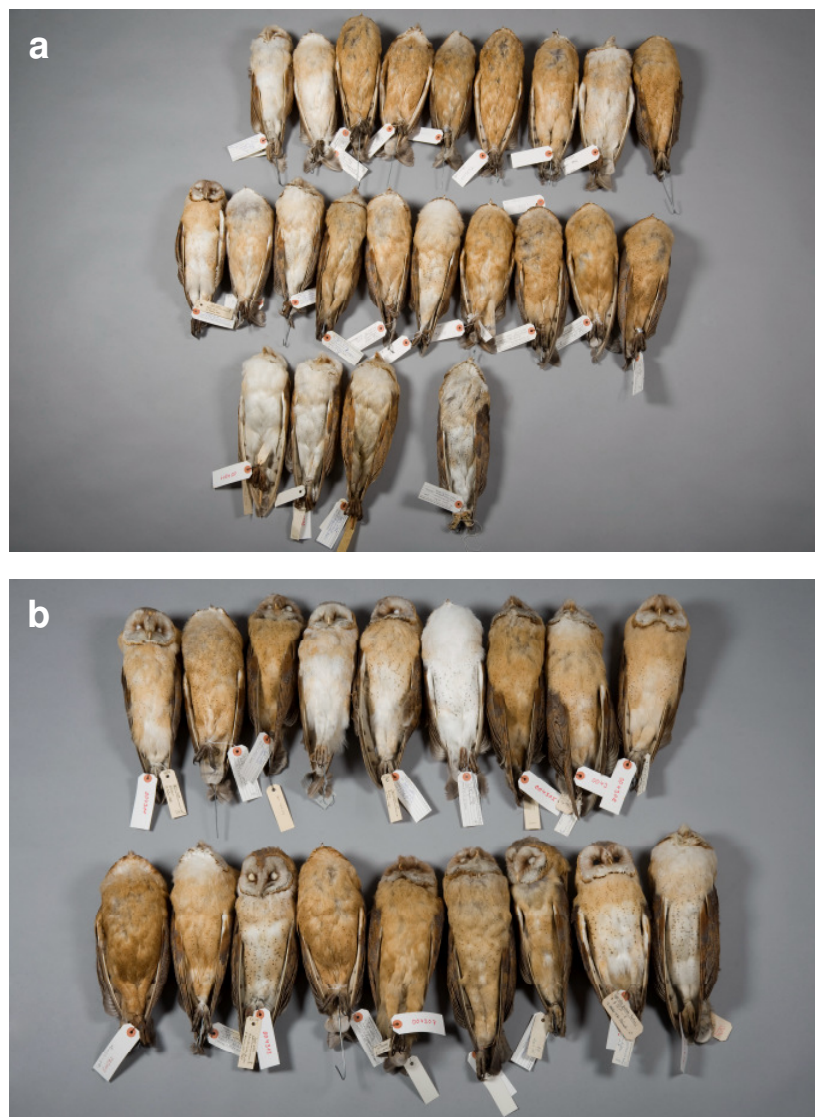
Abb. 2: Der Vergleich der Bälge zeigt deutlich, dass der dunkle Färbungstyp in Westfalen überwiegt. (a) Obere Reihe: Männchen, mittlere Reihe: Weibchen. Die linken drei Vögel der untersten Reihe stammen aus Spanien und sind somit sichere Vertreter von Tyto alba alba . (b) Obere Reihe: Männchen, untere Reihe: Weibchen.