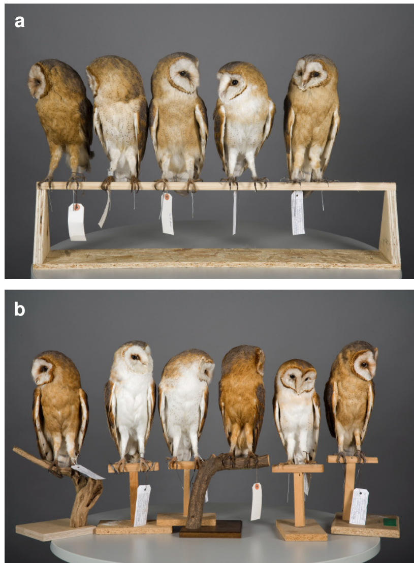
Abb. 1: Zwischen den Färbungsklassen (jeweils von links nach rechts) gibt es fließende Übergänge. (a) Klassen 5 – 3 – 3 – 2 – 4. Vierter von links ist ein dunkler Vertreter der Klasse 2. (b) Klassen 4 – 1 – 1 (2) – 5 – 2 – 4. Die Beispiele zeigen fließende Übergänge. Dritter von links mit weißer Unterseite aber schon deutlicher Fleckung (Dieser Vogel ohne Funddaten ist nicht in die Statistik eingegangen). Fünfter von links mit ebenso schwacher Fleckung, aber orangebeiger Tönung.